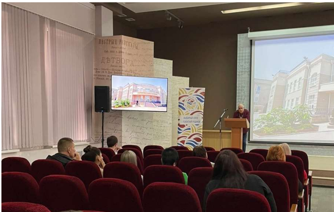
Рис. 7. Семинар для руководителей хозяйствующих субъектов города Таганрога по правам потребителей.

На сегодняшний день в Таганроге создана доступная система защиты прав потребителей. Эффективной формой обеспечения взаимодействия контролирующих служб, осуществляющих деятельность на городском потребительском рынке является организация работы с 2005 года Межведомственной комиссии по защите прав потребителей города Таганрога (далее – МВК).