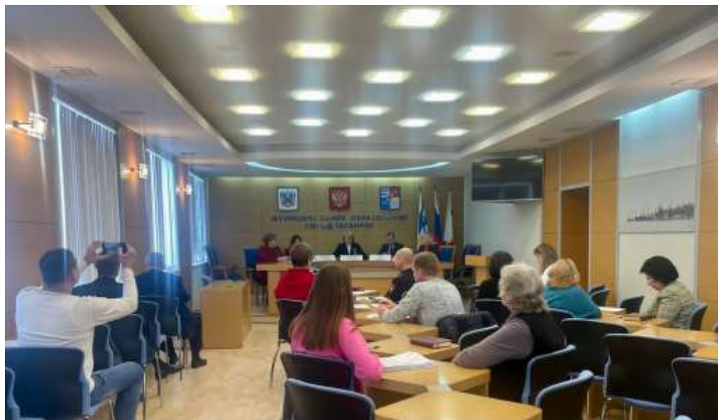
Рис. 6. Семинар в Администрации города Таганрога для руководителей хозяйствующих субъектов города Таганрога по правам потребителей.

В Законе Российской Федерации «О защите прав потребителей» две стороны – потребитель и продавец (изготовитель и исполнитель работ и услуг). Чтобы повысить качество и культуру обслуживания населения управлением потребительского рынка Администрации города Таганрога проводятся учебно-методические семинары, «круглые столы» с руководителями предприятий торговой отрасли, общественного питания, бытового обслуживания, производителей пищевой промышленности по вопросам действующего законодательства, сотрудниками управления подготавливаются всевозможные «памятки», сборники нормативных правовых актов, регламентирующие отдельные сферы торговой деятельности (Рис. 6, 7).