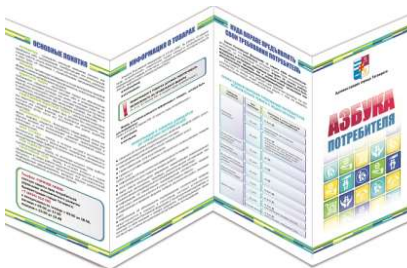
Рис. 4. Буклет-гармошка «Азбука потребителя»

адрес продавца по вопросу обмена или возврата недовольственного товара надлежащего качества.