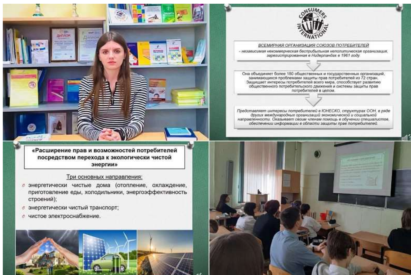
Рис. 9. Уроки для учеников старших классов общеобразовательных организаций города Таганрога по основам потребительских знаний в 2024 году.

В 2024 году проведено 107 уроков в онлайн формате для учащихся старших классов общеобразовательных учреждений города. Занятия направлены на увеличение правовой грамотности старшеклассников по теме девиза года: «Справедливый и ответственный искусственный интеллект». Количество учащихся, принявших участие в открытых уроках, составило 3290 человек (Рис. 9).