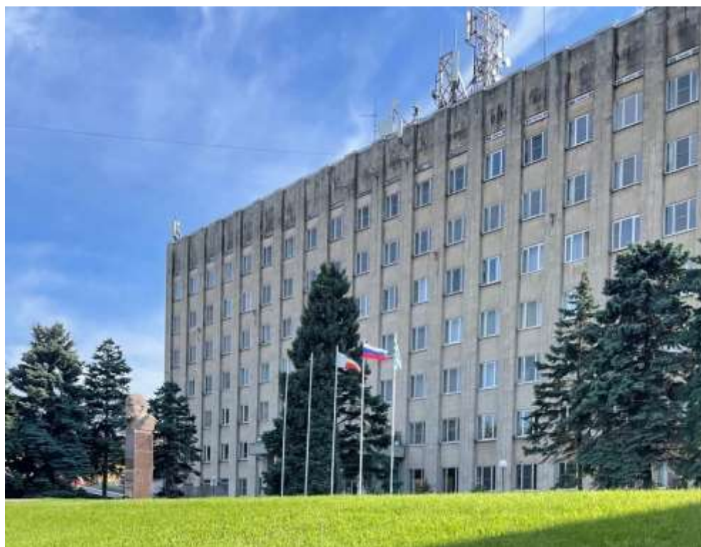
Рис. 1. Здание Администрации города Таганрога.

Из Стратегии государственной политики Российской Федерации в области защиты прав потребителей на период до 2030 года, утвержденной распоряжением Правительства Российской Федерации от 28.08.2017 № 1837-р21.