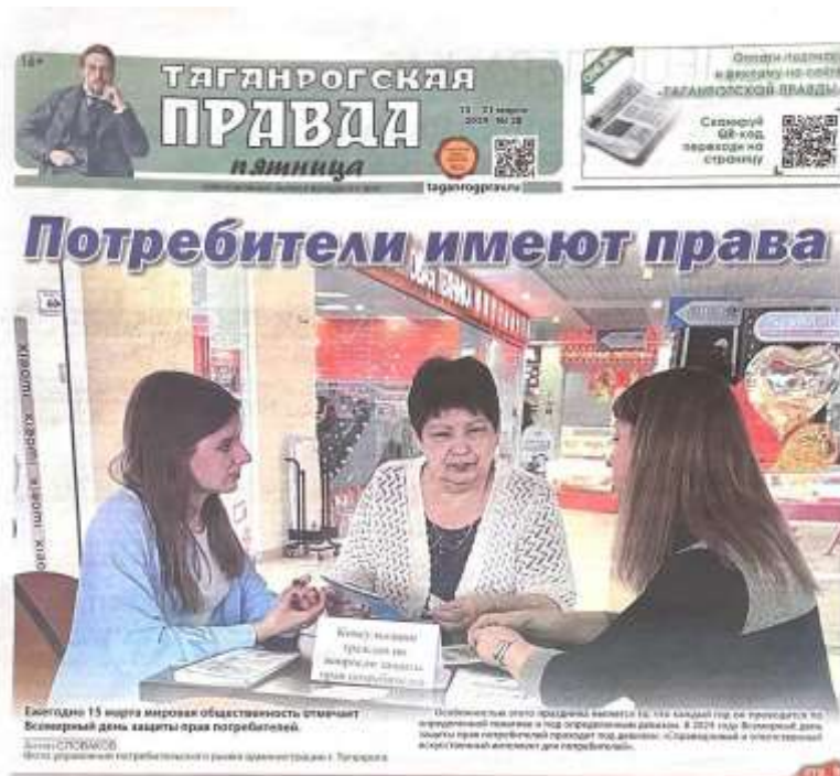
Рис. 13. Статья в газете «Таганрогская правда» в преддверии Всемирного дня защиты прав потребителей – 2024.