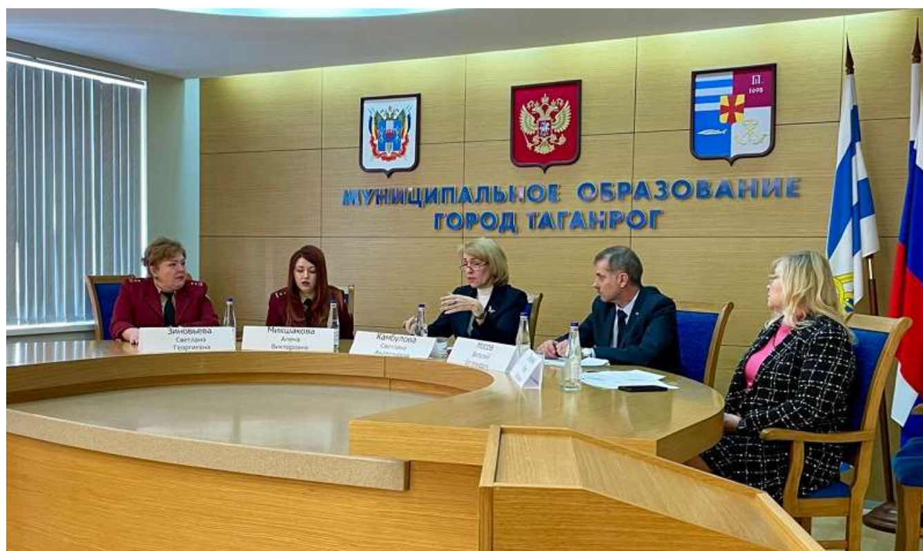
Рис. 8. Заседание межведомственной комиссии по защите прав потребителей города Таганрога.

Согласно положению о работе МК (утверждено постановлением Администрации города Таганрога от 08.10.2014 № 3156) заседания проводятся по мере необходимости, но не реже двух раз в год. На заседаниях заслушиваются отчеты контролирующих служб о результатах контрольных мероприятий, обсуждаются проблемные вопросы по обеспечению безопасности потребительского рынка, информация об изменениях в действующем законодательстве, намечаются совместные мероприятия (Рис. 8).