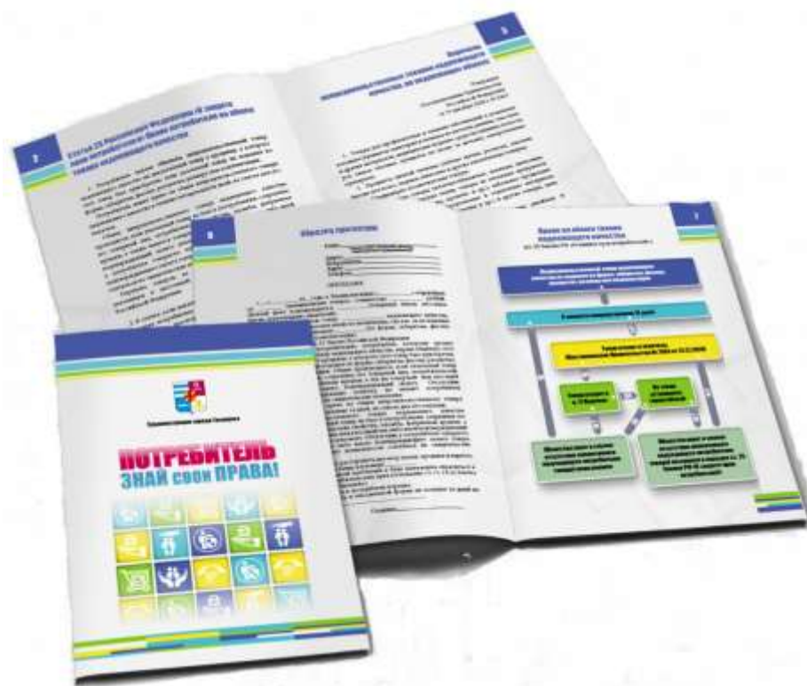
Рис. 5. Брошюра «Потребитель! Знай свои права!»

В целях обеспечения потребителя необходимой и достоверной информацией о товаре, работе, услуге, на основе которой он самостоятельно может сделать осознанный выбор, в секторе защиты прав потребителей имеется информационно-