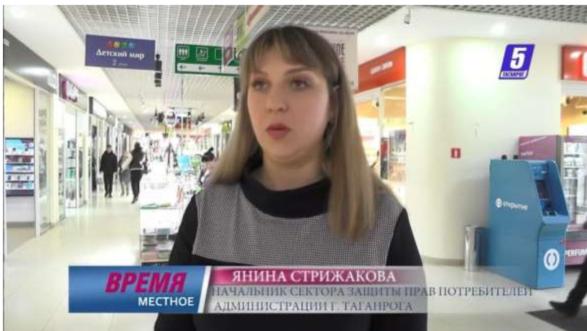
Рис. 3. Репортаж в телевизионной программе «Новости» на муниципальном телеканале «5-Таганрог» по теме Всемирного дня защиты прав потребителей в 2024 году.