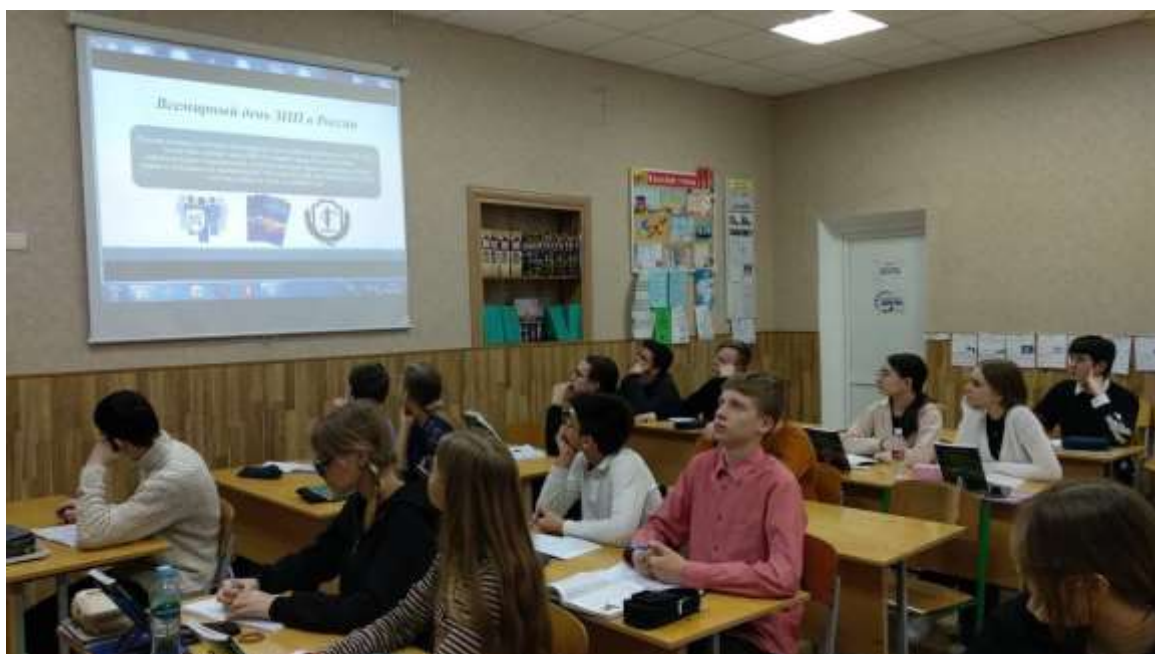
Рис. 10. Викторина по вопросам защиты прав потребителей для учеников общеобразовательных организаций города Таганрога по основам потребительских знаний.

Одним из способов просвещения и изучения информированности населения города в вопросах обеспечения защиты своих потребительских прав является организация и проведение выездных консультаций граждан по вопросам защиты прав потребителей в торговых центрах города.