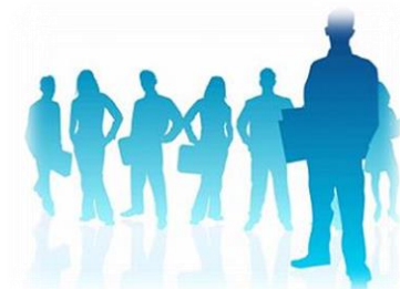
Встречи с субъектами МСП